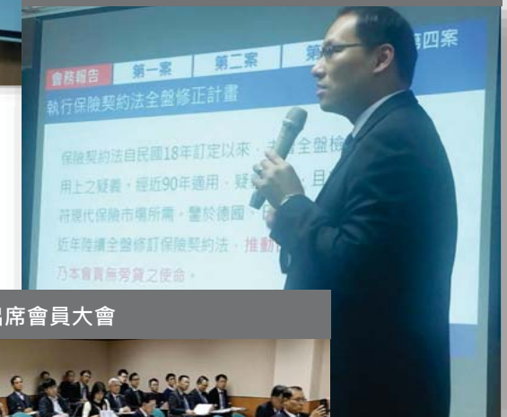
會員出席會員大會