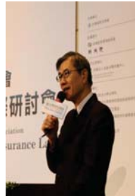
金管會黃天牧副主委